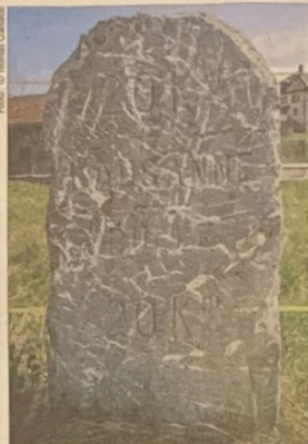
La ligne d'arrivée se situe à équidistance de Lausanne et de Bulle. Une borne en pierre siège à cet emplacement depuis plusieurs décennies

Quatre routes menant à Oron-la-Ville seront fermées de 8 heures à 20 heures. «La route de Moudon, la route de Palézieux, la route de Bulle et une partie de la route de Lausanne seront fortement perturbées à partir de 7 heures le matin», précise Marc Platel. «Attention, car une heure plus tard, ces axes seront bouclés à toute circulation». Cette heure permettra aux organisateurs d'installer les divers éléments de sécurité et le montage des portillons de départ et d'arrivée. Si le centre d'Oron n'est pas accessible durant toute la journée, des routes de déviations sont prévues afin de rejoindre Châtillens, Chesalles-sur-Oron et Palézieux.